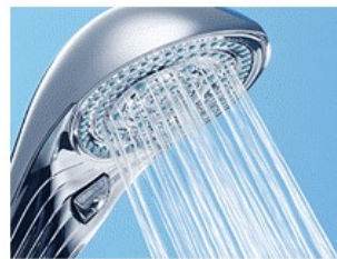
パワーストレート